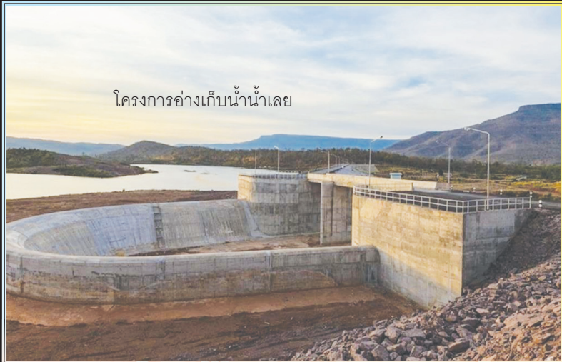
โครงการอ่างเก็บน้ำน้ำเลย

โครงการอ่างเก็บน้ำน้ำเลย อันเนื่องมาจากพระราชดำริในหลวงรัชกาลที่ 9 ตำบลแก่งศรีภูมิ อำเภอภูเรือ จังหวัดเลย ระยะเวลาดำเนินการตั้งแต่ปี พ.ศ. 2555-2557 ความสูงเขื่อน 28.50 เมตร ความยาวสันเขื่อน 500.00 เมตร ความกว้างสันเขื่อน 8.00 เมตร ความจุเก็บกักน้ำ 35.29 ล้านลูกบาศก์เมตร วัตถุประสงค์ของการสร้างอ่างเก็บน้ำเพื่อให้มีน้ำเพียงพอสำหรับส่งเข้าพื้นที่เพาะปลูก พื้นที่ชลประทาน จำนวน 59,592 ไร่ เป็นแหล่งเก็บกักน้ำสำหรับอุปโภคบริโภคได้ตลอดปี เป็นแหล่งเพาะพันธุ์สัตว์น้ำ อีกรังเพื่อบรรเทาอุทกภัย และเป็นสถานที่ท่องเที่ยว มีบริการล่องแพเพื่อชมทิวทัศน์รอบ ๆ อ่างเก็บน้ำ