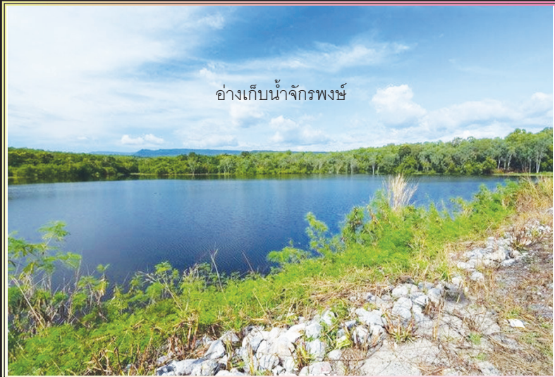
อ่างเก็บน้ำจักรพงษ์

ขอแสดงความยินดี เนื่องในโอกาส วันคล้ายวันสถาปนา กรมชลประทาน